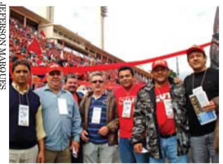
Nossa diretoria presente em ato da CUT no Pacaembu, em São Paulo

com maior influência e responsabilidade sobre a classe trabalhadora. É organização sindical de massa, classista, autônoma e democrática, com princípios de igualdade e solidariedade entre os trabalhadores e trabalhadoras do Brasil.