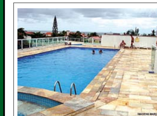
Colônias de férias o ano inteiro