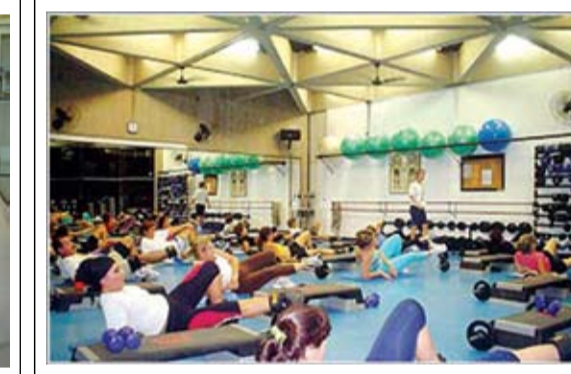
Convênio com o Sesc Santos