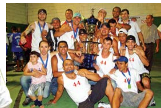
Point 44, campeão da edição 2010 do torneio