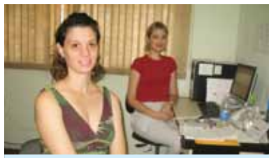
As secretárias do Sindicato, cuidando das reservas nas colônias e agendamento das homologações, além da triagem das reclamações que chegam até o nosso Sindicato.