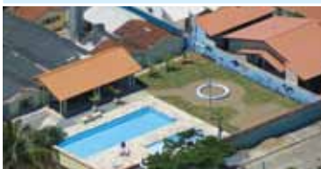
Colônia de Peruíbe 2