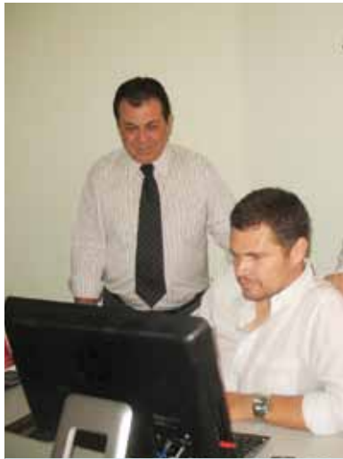
O presidente Orides Rodrigues e advogados: fiscalizando o site do TRT: agilidade no andamento dos processos.