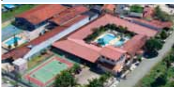
Colônia de Caraguatuba