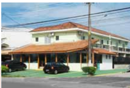
Colônia de Peruíbe da Ferthoresp