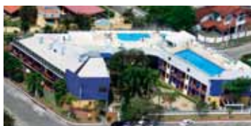
Colônia de Peruíbe 1

Para conhecê-la, basta acessar o site www.ferthoresp.com.br e marcar sua reserva, ligue para o nosso Sindicato (19) 3254-1830 e fale com uma de nossas atendentes.