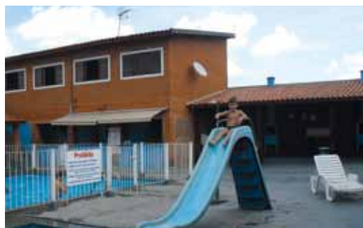
Duas piscinas, adulto e infantil a disposição dos trabalhadores