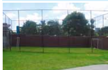
Mini campo de futebol society